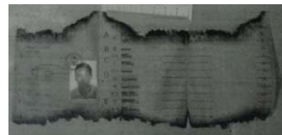
Carné de conducir de "El chino" quemado por dos bordes, el fuego, sospechosamente, no afecta a la fotografía. No se encuentran huellas.

No hay una autopsia completa que analice la hora y causas de la muerte de estos "suicidas" (¿O "suicidados"?). Informe que es de obligado cumplimiento hacer (Y exigir a tiempo).