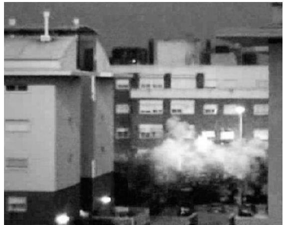
La explosión captada por un videoaficionado.