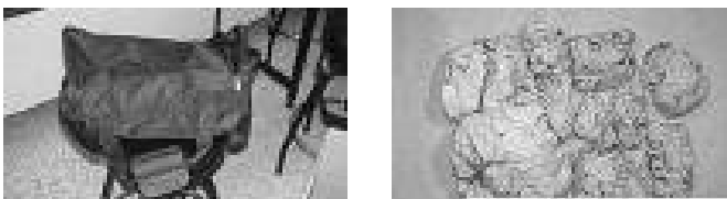
Imagen del sumario y el explosivo que contenía. Las primeras imágenes solo las obtuvo ABC (USA). Hasta entonces se hablaba de "mochila" luego se vio que era "bolsa" y estaba nueva, con pliegues de estrenada.

En la noche del 11 al 12, la Policía de Puente de Vallecas, mientras revisaba los objetos personales recogidos en El Pozo, encuentra un artefacto explosivo en una bolsa, compuesto por un móvil conectado por unos cables a un detonador y a una masa explosiva.